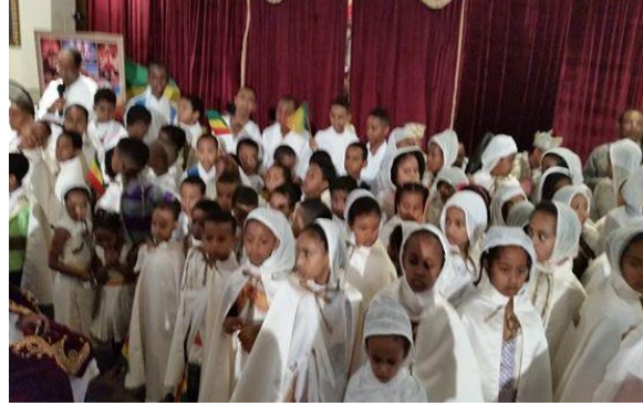
ሕፃናት በመዝሙር አገልግሎት።

ሁላችንም ዛሬ አንድ ነገር ቀረን፤ ሊፈጸም የሚችል እንዲህ ሕብረት ካለን። ቋንቋችን ግልጽ ነው ያለው ከእኛ አንደበት፤ ለእግዚአብሔር ማደሪያ ስፍራ ማዘጋጀት። ቤት ሥሩልኝ ብሎ አምላክ የመረጠን፤ እንዴት ቢወደን ነው ለዚህ ክብር ያሰበን። በእግዚአብሔር ይወደድ የእውነት ግብራችን፤ የ ሥላሴ ክብር ይግባ በቤታችን።